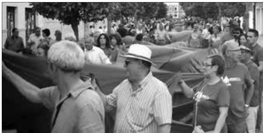
Manifestación en Alcázar de San Juan

Los 8 fueron conducidos al módulo de preventivos en Puerto