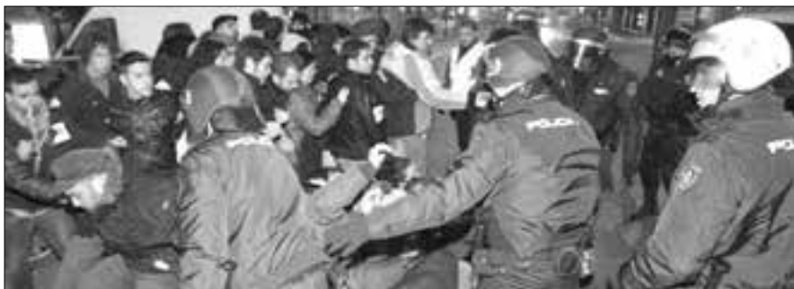
Enfrentamientos en Gijón