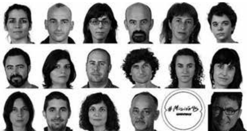
Los diecisiete de Cofrentes (Valencia)

Las movilizaciones en la calle y las charlas-debate han sido