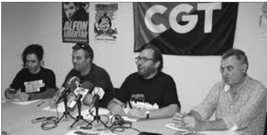
La gira en Alcázar

continuas durante estos meses para difundir este atropello.