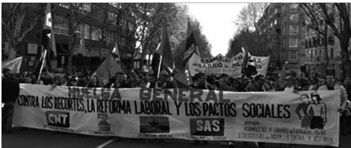
De arriba a abajo: Detenciones arbitrarias de policías antidisturbios y secretas. Manifestación del sindicalismo alternativo en la Huelga General 14-N, Cargas el 22-M de 2014. Cabecera de la manifestación alternativa Huelga General 29-M 2012